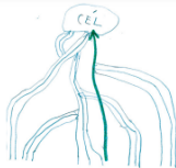
2. célok, elvárások tisztázása