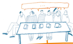
12. a ceremóniamesterek, a zsűri és a támogatók felkérése