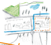
4. a célterület lehatárolása