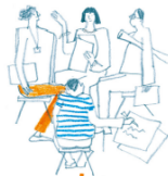
3. a szervezői csoport kialakítása