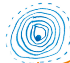
5. a motiváció meg