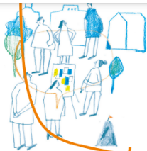
1. a helyi szándék megfogalmazása